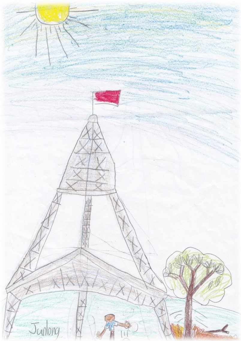
(Junlong Sun, 6 岁；指导老师：Alice Zhao)