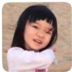
颖 🌸 🌸