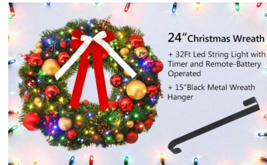
24" Christmas Wreath

https://www.amazon.com/gp/product/B075L7VL92