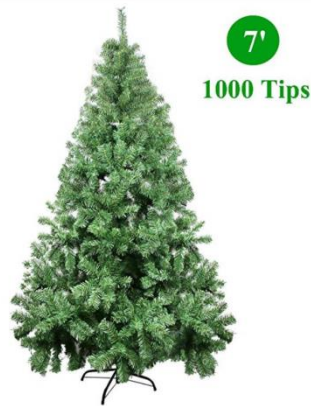
7' Christmas Tree

All the Christmas trees / wreaths are $20 each for PTA fundraising SALE! Please support PTA and school sponsor. Order online and pick up on site!